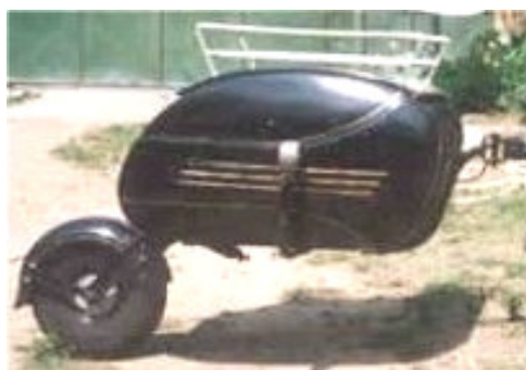
Prívěsný vozík MOTEX